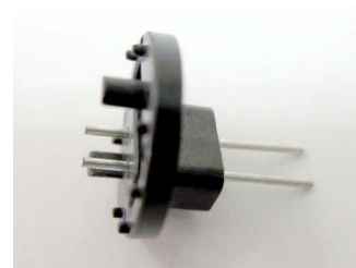
針状インサート成形品