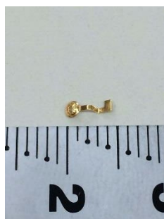
極小サイズインサートワーク